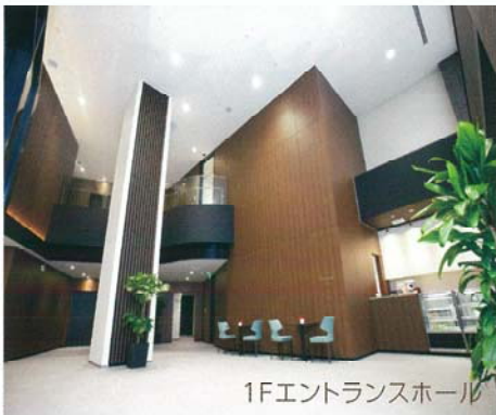
1Fエントランスホール