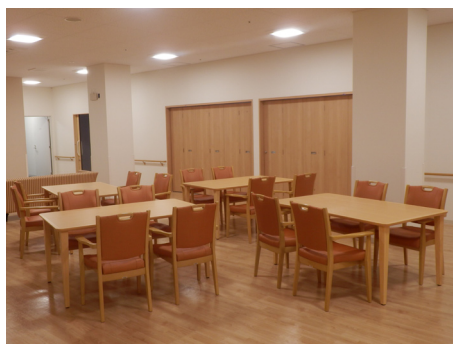
通いサービススペース